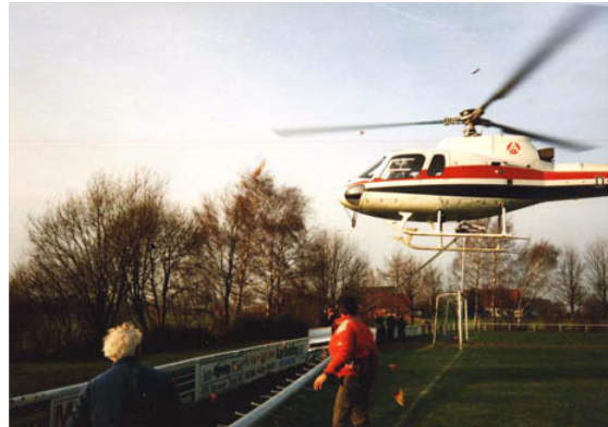
Kein Hilfsmittel zu gefährlich. Schon früh wurden auch Hubschrauber zur Montage der Flutlichtanlagen eingesetzt.

Die Familie Röbber plant, vertreibt und montiert Flutlichtanlagen im gesamten Bundesgebiet. Von der Finanzkrise blieb das Unternehmen bislang verschont und vermeidet sogar einen Umzug in eine größere Betriebsstätte. Für das neue Jahr zeigt man sich optimistisch.