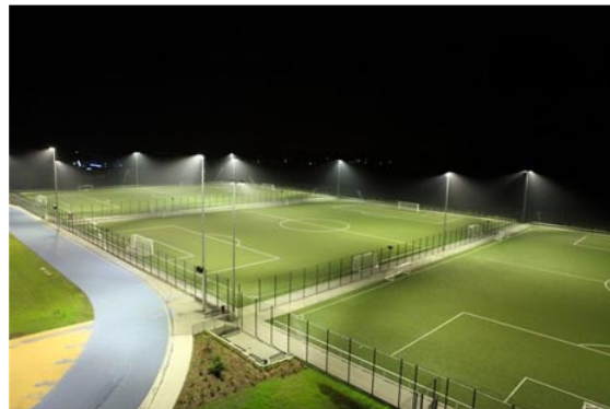
Bei dem Sportzentrum Rosenzentrum in Falkensee konnten die Masten aufgrund der parallelen Anordnung der Sportfelder gleich mehrfach verwendet werden